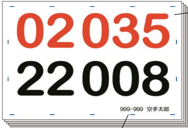
会員番号・選手名入り

兵庫県空手道連盟主催競技大会にて、大会用ゼッケンの斡旋販売を致します。 ゼッケン番号・会員番号・選手名・指定の縫い目の場所を印刷してお届けします。 なお、この斡旋販売は、任意です。別途ゼッケン制作方法に従い各自でお作り頂くことを基本としています。 形・組手の2競技用